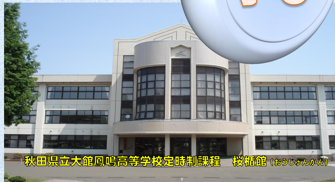
秋田県立大館鳳鳴高等学校定時制課程 桜楯館 (おうじゅんかん)