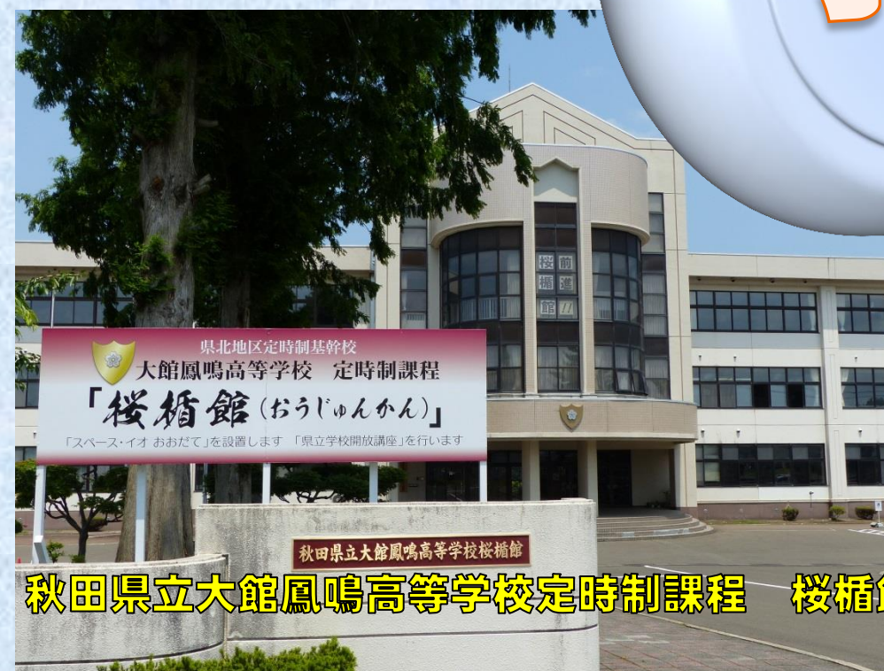
秋田県立大館鳳鳴高等学校定時制課程 桜楯館(おうじゅんかん)