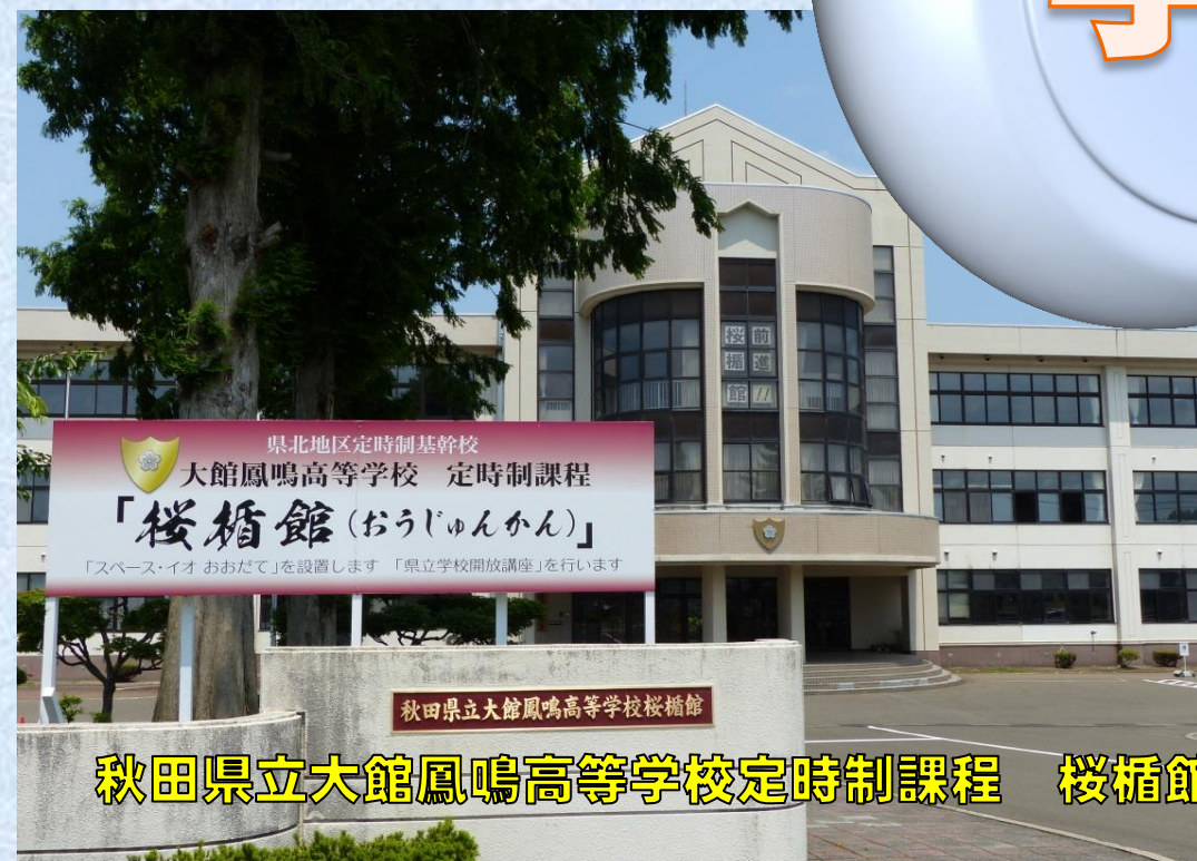
秋田県立大館鳳鳴高等学校定時制課程 桜楯館 (おうじゅんかん)