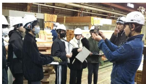
ティンバラム株式会社

地元企業を知ることや進路意識を高めることを目的に『ティンバラム株式会社』『東光鉄工株式会社』の2社を見学させていただきました。参加した生徒は「地元で日本や世界に通用する技術をもった会社があることを知り驚いた。」などの感想を述べ、地元大館のすばらしさを実感していました。