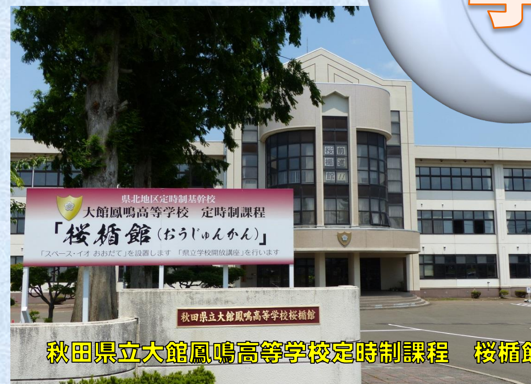
秋田県立大館鳳鳴高等学校定時制課程 桜楯館 (おうじゅんかん)